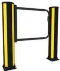
歩行者バリア・安全ガード 歩行者用ゲート

ユニバーサルハンド、自動閉鎖。幅は690 mm～1210 mmまで調節可能です。