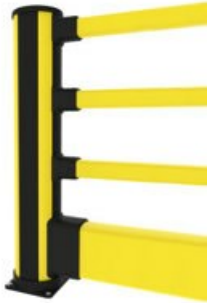
歩行者バリア・安全ガード 歩行者+インパクトガード

X-Protect歩行者+インパクトバリア構成を使用して、地上からの衝撃のリスクが高い中型車両から歩道を保護します。歩行者用ゲートと組み合わせることも可能です。歩行者用ゲートは自動閉鎖式で、ユニバーサルハンドル付き、幅は690～1210 mmの範囲で調節可能です。