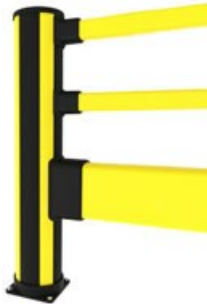
歩行者バリア・安全ガード 歩行者+インパクトガード(高)

X-Protect歩行者+インパクト高バリア構成を使用して、地上からの衝撃のリスクが低い中型車両から歩道を保護します。歩行者用ゲートと組み合わせることも可能です。歩行者用ゲートは自動閉鎖式で、ユニバーサルハンドル付き、幅は690～1210 mmの範囲で調節可能です。