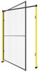
安全柵扉・ドア シングルヒンジドア

シングルヒンジドアは通常、出入口ドアとして、またはロック機能の選択により非常口として使用されます。